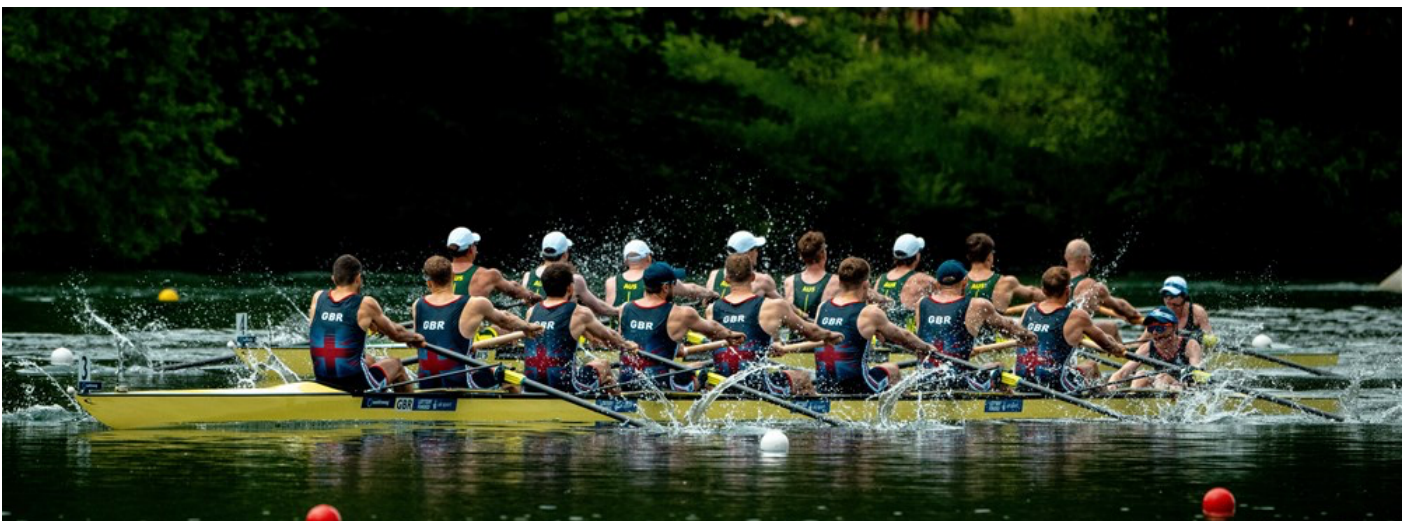
Le M8+ Britannique en finale à Lucerne

La stat en plus : 50 athlètes (41 OLY et 9 PARA) ont enchaîné : Régate Finale de Qualification Olympique et 2 e manche de la Coupe du Monde. Principalement des nations extra-européennes (USA 9, UZB 8, CHI 8, HKG 6), mais aussi la Suisse (M4-, W1x).