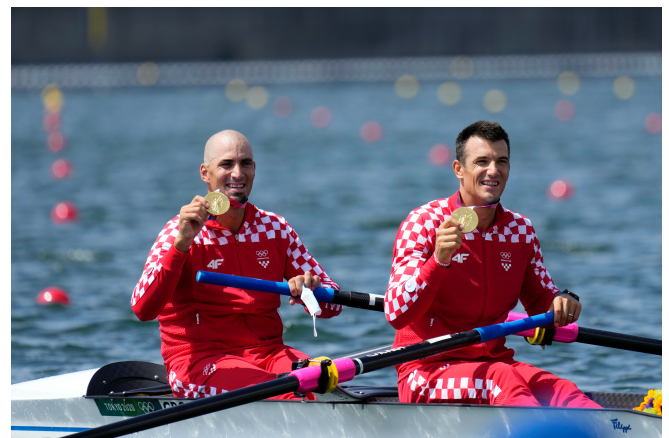
M2- : CROATIE (V. Sinkovic, M. Sinkovic)

Aucun rameur U23 aligné dans cette discipline malgré la présence de 2 équipages allemands et 2 équipages italiens.